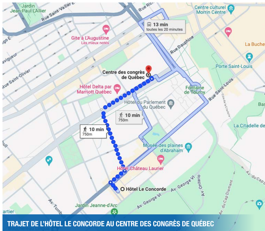
TRAJET DE L'HÔTEL LE CONCORDE AU CENTRE DES CONGRÈS DE QUÉBEC

Il est demandé aux participants internationaux de se rassembler dès 7h00 dans le hall d'accueil des hôtels Le Concorde et Château-Laurier. Les équipes de l'OIF et de ses partenaires orienteront les participants sur le trajet des hôtels au Centre des congrès de Québec. L'accueil des participants, agrémenté d'un petit-déjeuner continental débutera à 7 h30.