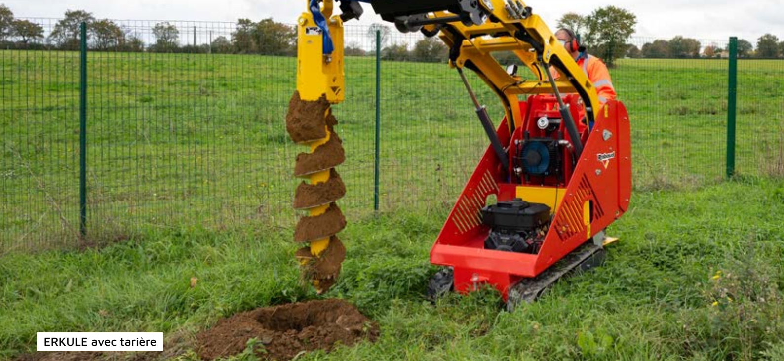
ERKULE avec tarière