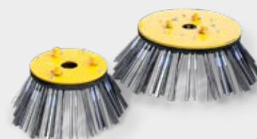
2 diamètres de brosse au choix