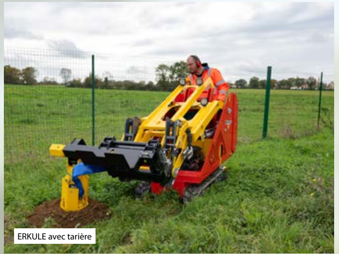
ERKULE avec tarière