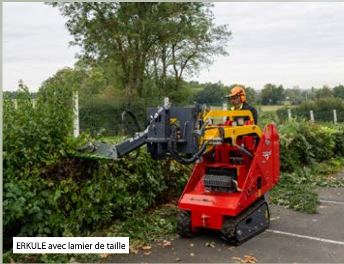
ERKULE avec lamier de taille