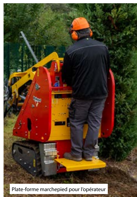
Plate-forme marchepied pour l'opérateur