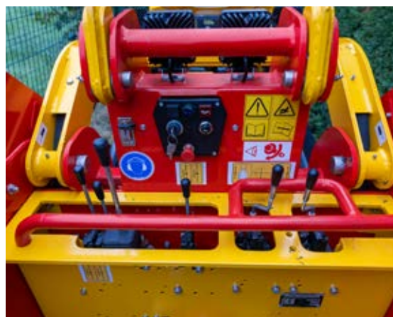
Commandes type mini-pelle