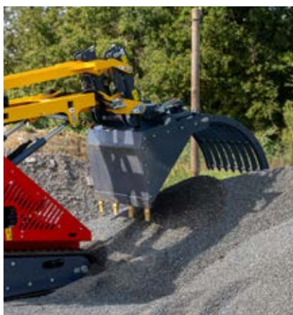
Vérin de cavage