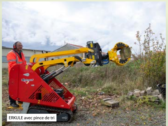
ERKULE avec pince de tri

02/2026 - Les caractéristiques techniques et les photos sont données à titre indicatif et peuvent être modifiées sans préavis.