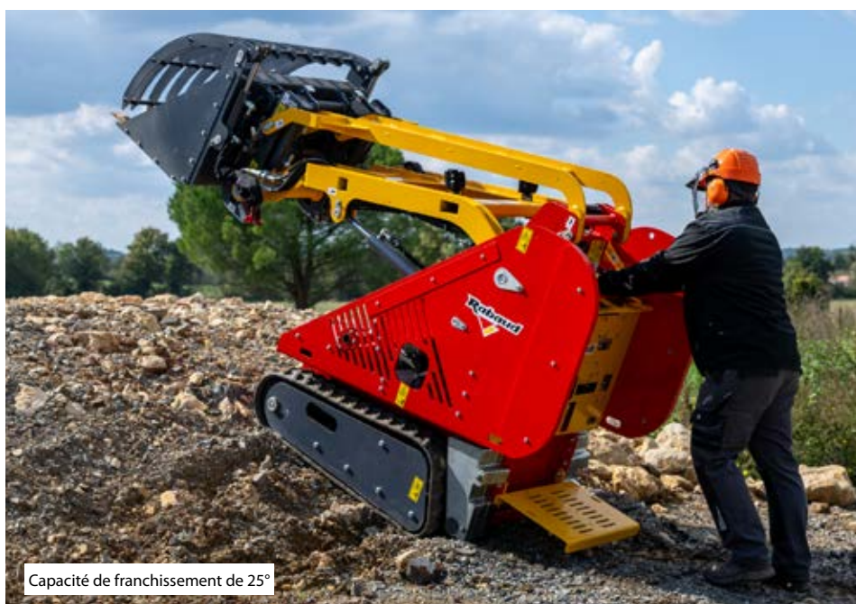
Capacité de franchissement de 25°