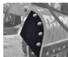
Kit benne preneuse