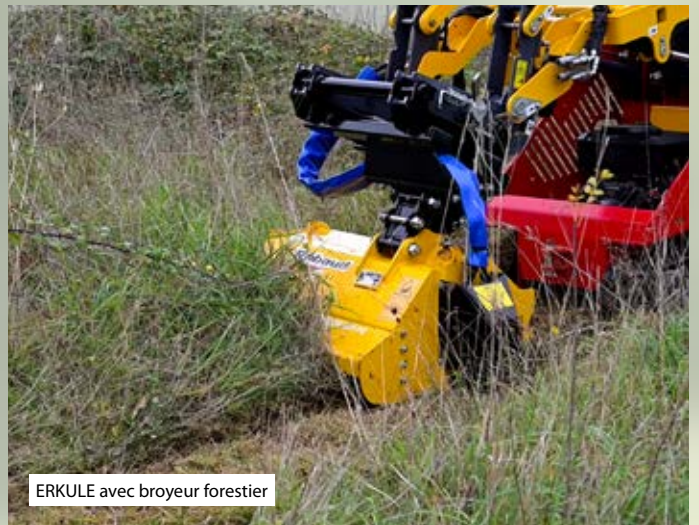
ERKULE avec broyeur forestier