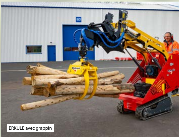
ERKULE avec grappin