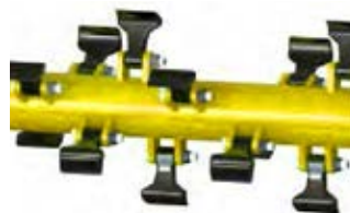
Rotor à marteaux mobiles