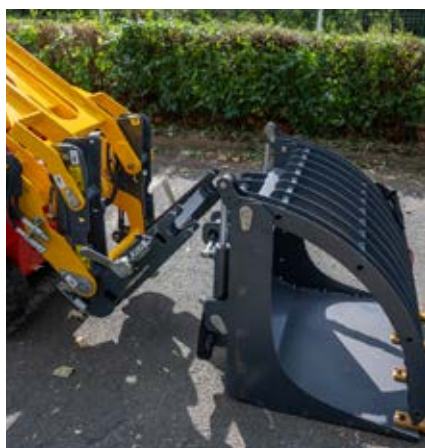
Bras avec attache rapide compatible avec une large gamme d'outils RABAUD