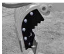
Kit SUPER GRIP