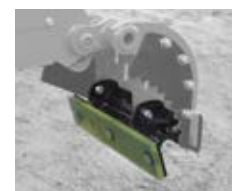
Kit pose bordures