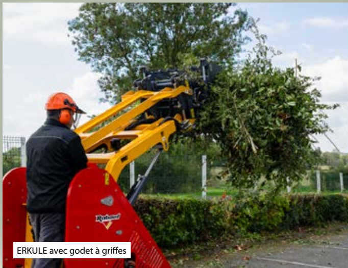
ERKULE avec godet à griffes