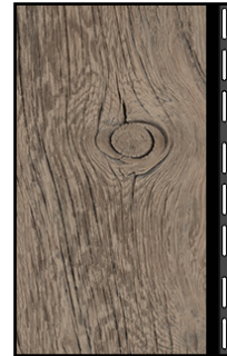
lame préperçée - trous oblongs vue de dessus