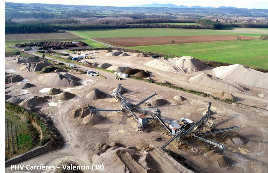
PHV Carrières – Valencin (38)