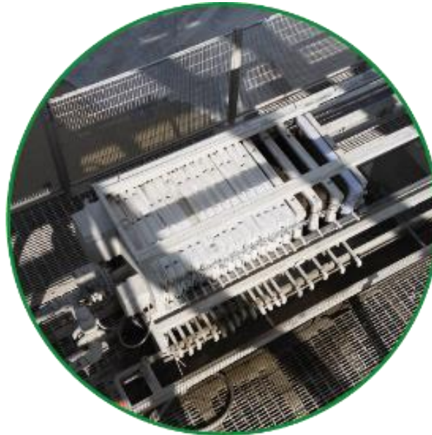
Presse à boue