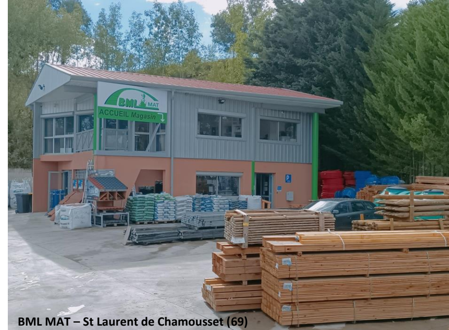
BML MAT – St Laurent de Chamousset (69)