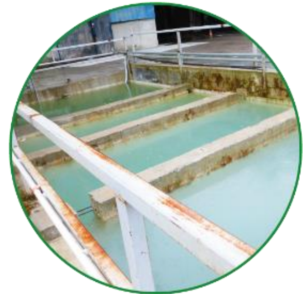
Décantation des eaux

➤ Réintroduction de l'eau dans la production