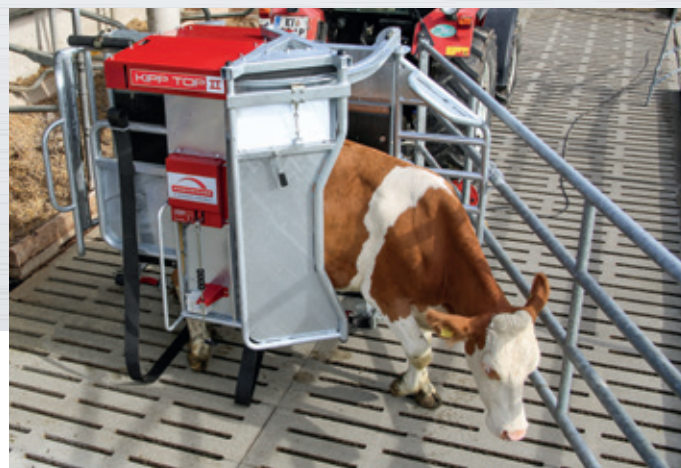
Weit öffnender Austrieb nach vorne und seitlich