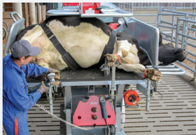
Beste Arbeitshöhe, Werkzeug immer in Griffweite