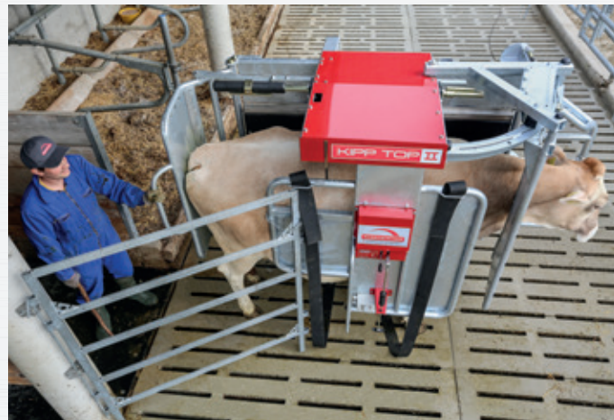
Leichter und schneller Eintrieb