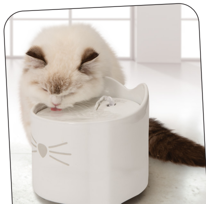
1ère Place | Cat it / Hagen Fontaine à eau en céramique pour chats

Le coup de coeur de plus de 2 000 votants, professionnels et des consommateurs