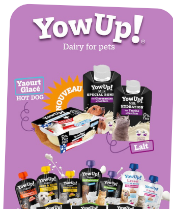
2e Place | YowUp ! Les yaourts pour chiens & chats