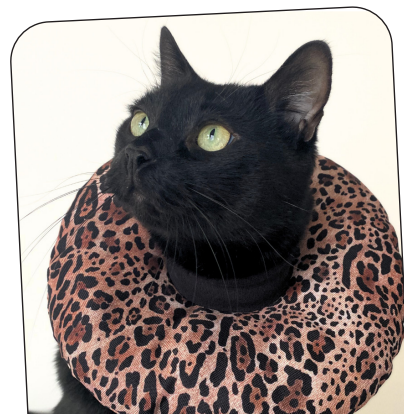
3e Place | Romy'Nou Colerette ajustable pour chat BOBO imprimé GRAOU