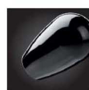
Noir foncé Gris noir