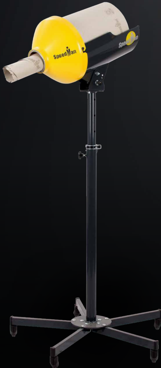
SpeedMan® Classic avec support à roulettes

PACKlight S.A.S 484 Route de La Croix Lepin 69620 SAINT-VERAND Tél : 04 26 72 16 53 www.packlight.fr