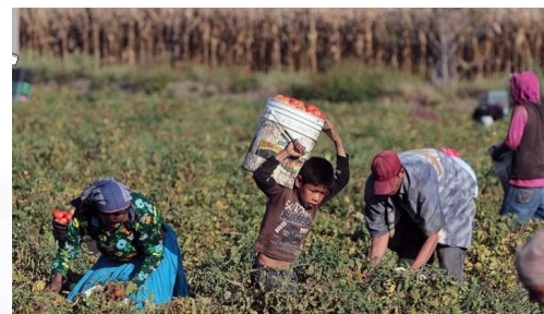
4. Trabajo forzado