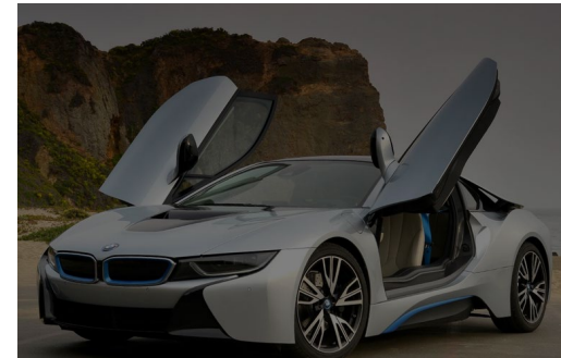
6. Vehículos de alta gama