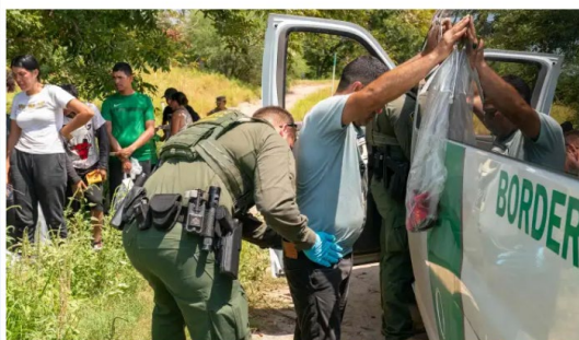
Migrantes son detenidos por la Patrulla Fronteriza en la frontera sur de EE. UU.

Por Julio Román 23 de octubre de 2023 a las 11:10h