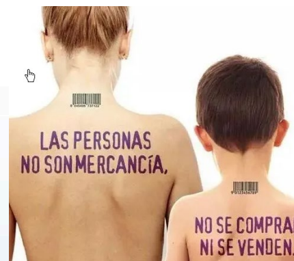
4. Trata de personas