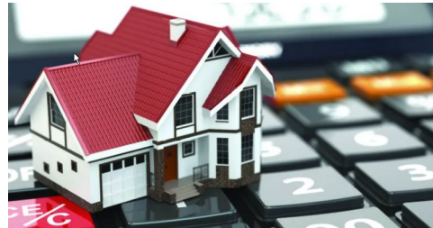
5. Obtención de bienes inmuebles