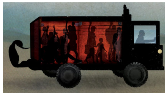
2. Riesgos de asfixia y deshidratación en contenedores