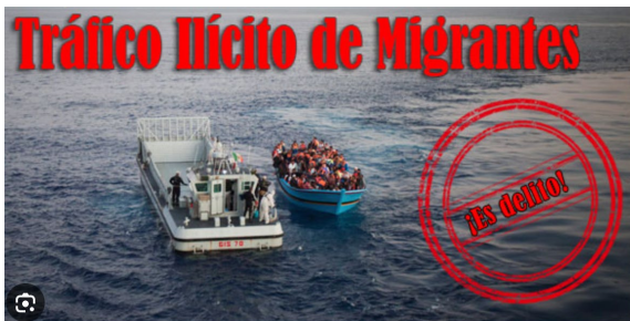
1. Tráfico Ilícito de Migrantes