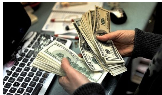
2. Lavado de dinero