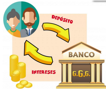
2. Depósitos de ahorros