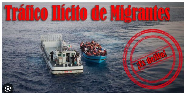
1. Medios de transporte