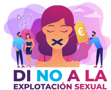
3. Explotación Sexual