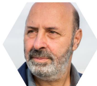
Cédric KLAPISCH Réalisateur, Scénariste et Producteur