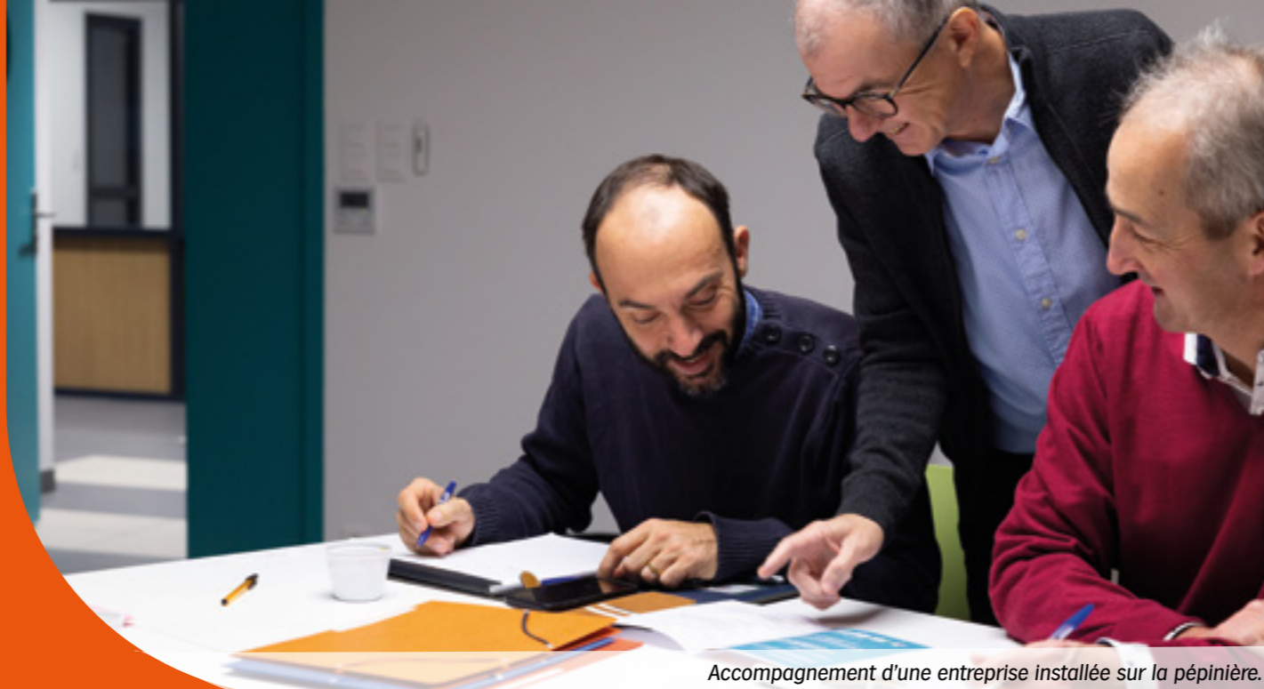
Accompagnement d'une entreprise installée sur la pépinière.

Le Cluster Plantes regroupe des entreprises et centres de recherche, afin de développer des alternatives aux traitements chimiques.