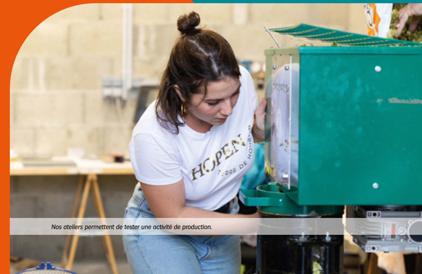
Nos ateliers permettent de tester une activité de production.

INTERNET une connexion Internet à très haut débit grâce à la fibre optique