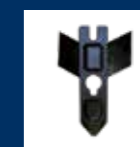
Sabot à ergots