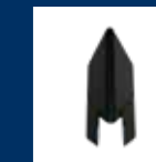
Nez de protection