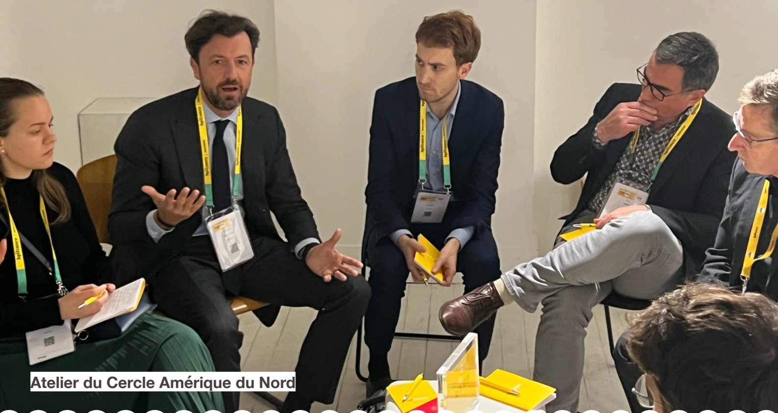
Atelier du Cercle Amérique du Nord