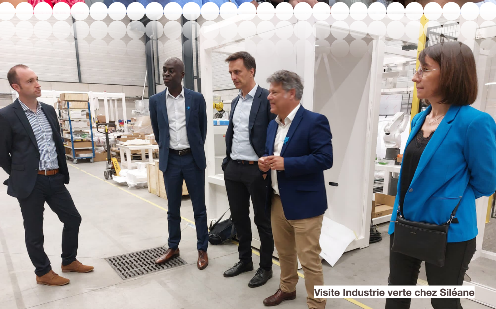
Visite Industrie verte chez Siléane