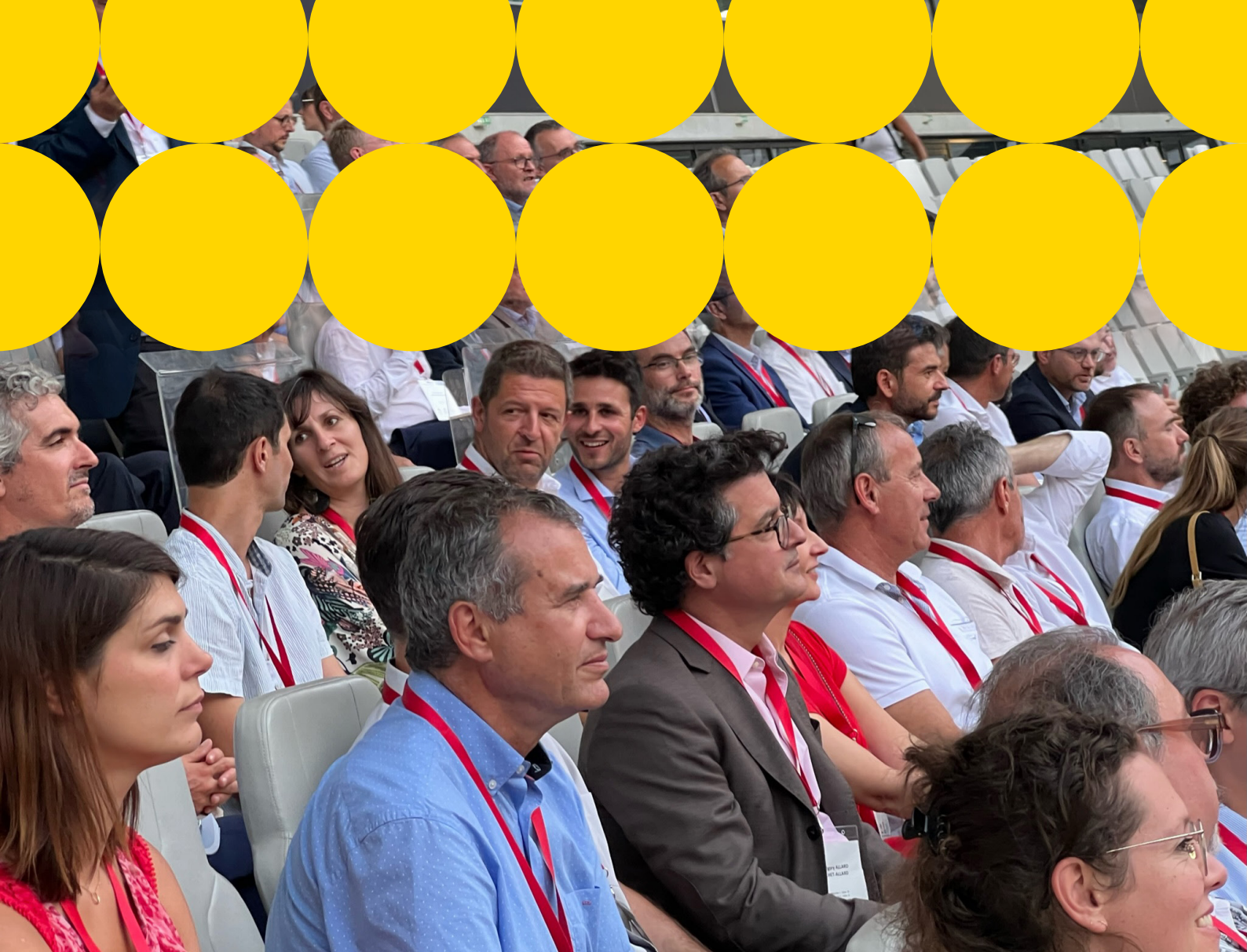
Événement avec la Région Nouvelle Aquitaine au Matmut Atlantique