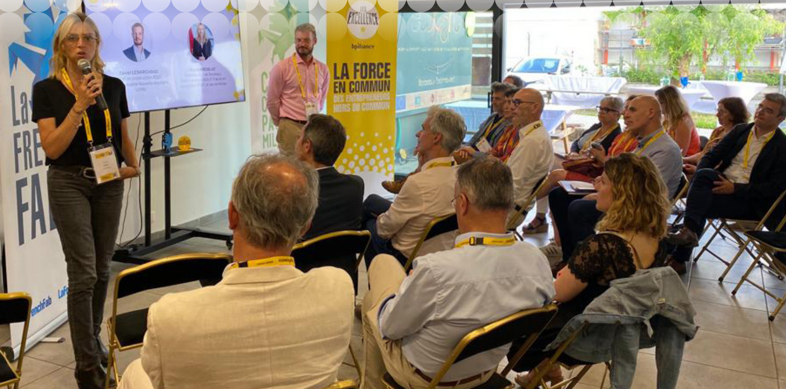
Décarbonation et industrie chez Sunna Design