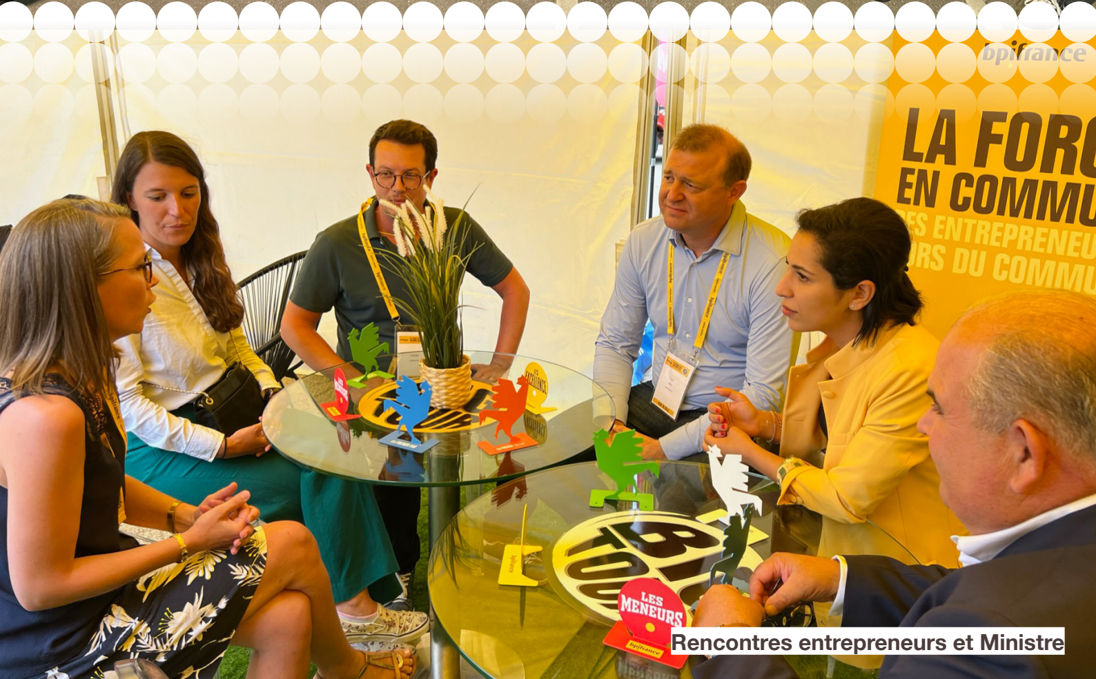
Rencontres entrepreneurs et Ministre