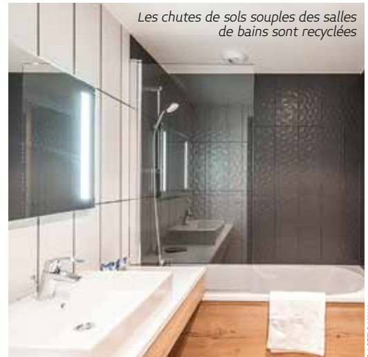
Les chutes de sols souples des salles de bains sont recyclées

Ossabois, une entreprise de la Loire, a livré la résidence hôtelière en blocs modulaires bois la plus haute d'Europe, au Corbier. Conçue par l'atelier landais Hubert Architecture, l'Étoile des Sybelles est composée de 310 modules en bois préfabriqués et empilés sur 8 étages. Un investissement de Maulin.Ski, la société d'exploitation du Domaine skiable des Sybelles. Par Clotilde Brunet