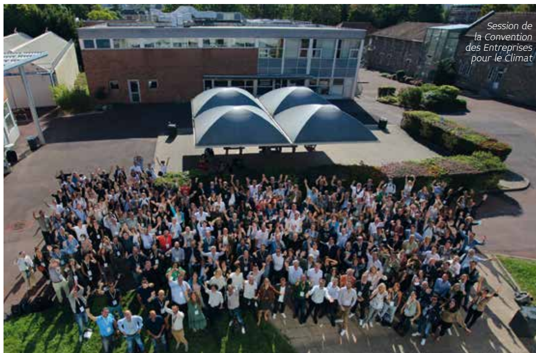
Session de la Convention des Entreprises pour le Climat

On en a tenu compte dès le départ en travaillant avec «Pour un réveil écologique», une association qui rassemble des étudiants de grandes écoles. Ils font aussi partie du comité des garants, toujours pour éviter que la CEC soit étiquetée comme un énième mouvement patronal qui veut se donner bonne conscience. Ils se-