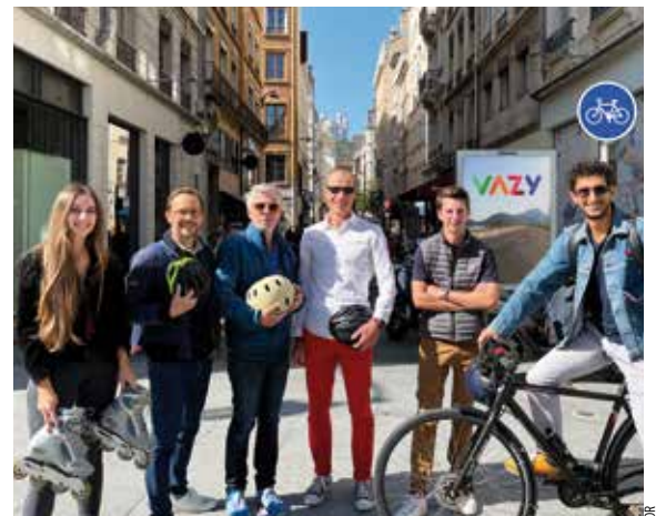
Plus de 100 commerçants lyonnais sont partenaires de WAZY

Inciter à se déplacer à pied, trottinettes ou vélo plutôt qu'en voiture, et récompenser ces efforts par des réductions dans des commerces de proximité, c'est l'idée de Loïc Robbiani après une carrière de com-