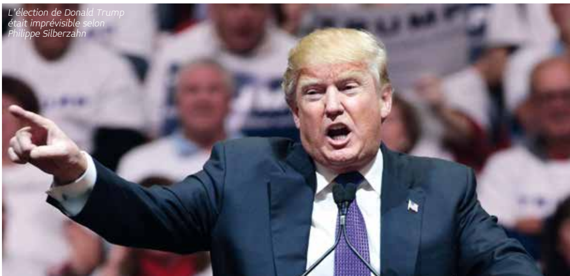
L'élection de Donald Trump était imprévisible selon Philippe Silberzahn